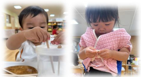
ゆび先を動かして挑戦!